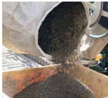
2. MIXEN BINDMIDDEL EN SPLIT IN DE BETONMOLEN