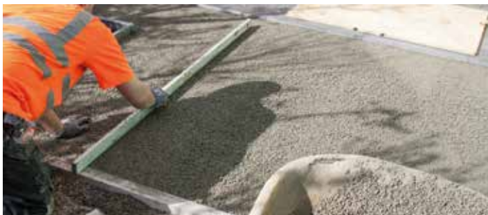
3. AANBRENGEN VAN DE DRAINAGEMORTEL EN AFREIEN TOT EEN LAAG DIKTE VAN 4 CM