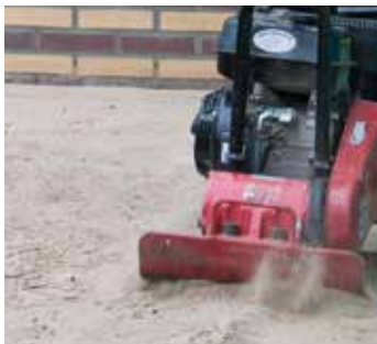
1. VERDICHTEN VAN HET ZANDBED