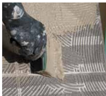
5. AANBRENGEN VAN DE LIJM OP DE ONDERKANT VAN DE TEGEL