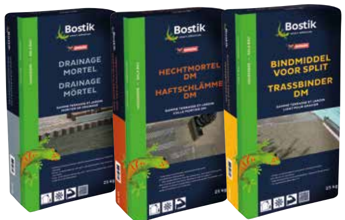
Bostik Hoveniers Bindmiddel voor Split, zak 25 kg, artikelcode 30608932 Bostik Hoveniers Hechtmortel DM, zak 25 kg, artikelcode 30608933 Bostik Hoveniers Drainagemortel, zak 25 kg, artikelcode 30608760

Leg de keramische tegels bij voorkeur met een voeg van minimaal 3 mm. Dit om beschadigingen van de randen te voorkomen.