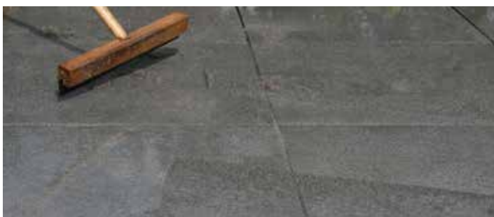
7. BESTRATING INVOREN MET BOSTIK HOVENIERS VOEGMORTEL 1C FLEX