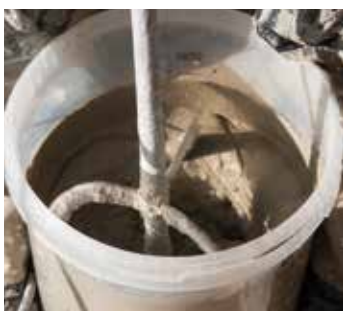
4. MIXEN VAN DE LIJM