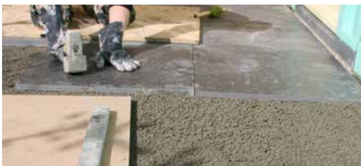
6. INKLOPPEN VAN DE TEGEL IN DE DRAINAGEMORTEL